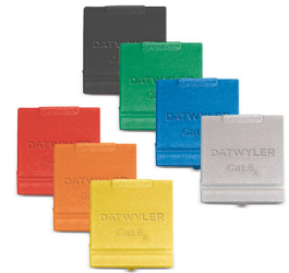
Module MS-K Plus 1/8 Cat.6A, afgeschermd, met stofluikje