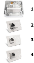
Aansluitdoos AP IP44 voor 2 modules Opbouw