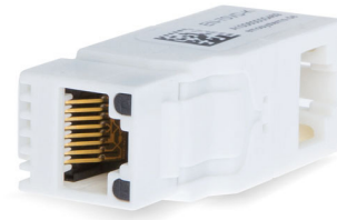
Hoogwaardige Netwerk isolator EN-70VD-K, 90°